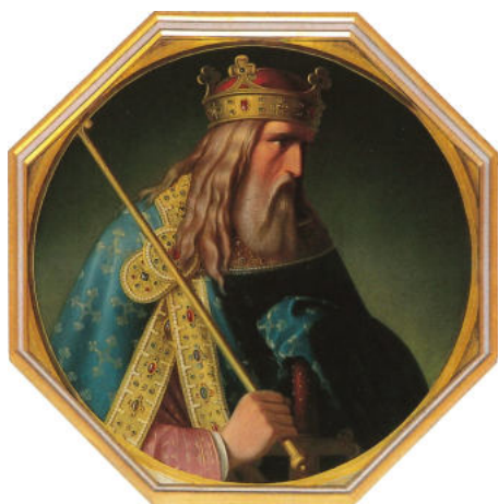
Zum 11. Wittekind-Tauschtag in der ostwestfälischen Gemeinde Hiddenhausen setzt die Post am 22. Januar 2023 einen hochinteressanten Sonderstempel mit der Abbildung von Kaiser Ludwig dem Frommen ein, hier ein idealisiertes Portrait des Kaiser aus Wikipedia, das als Vorlage diente. Ein Event-Team der Post ist vor Ort im Einsatz.

Das Frauenstift Herford wurde 789 in Müdehorst bei Bielefeld gegründet und dann um 800 nach „Herifurth“ an die Mündung der Aa in die Werre verlegt. Schon 823 wurde das Kloster parallel zur Gründung des Klosters Corvey zur Reichsabtei erhoben. Nach der sog. „Herforder Vision“, der ältesten bekannten Marienerscheinung nördlich der Alpen um 1011, stieg die Bedeutung des