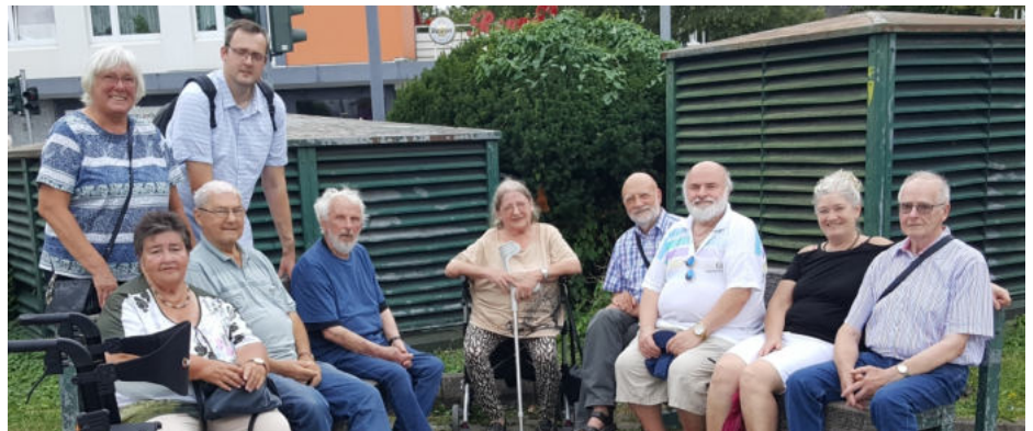
Die Schwerter Briefmarkenfreunde auf ihrem Vereinsausflug